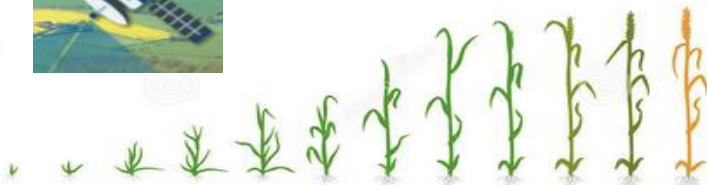
Epi 1 cm

Le satellite survole vos parcelles début février pour évaluer la biomasse de la culture.