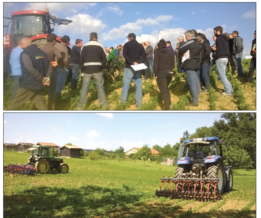
Démonstrations de matériels de désherbage mécanique à Sarrant le 8 juin.

4. Chaque agriculteur peut également bénéficier d'un suivi personnalisé , par un conseiller spécialisé, sur les 5 ans du PAT. L'accompagnement technique peut porter sur un volet agronomique renforcé, sur l'aménagement de zones tampons, la gestion de la ripisylve, l'agroforesterie... Les partenaires du programme proposent également un programme concerté d' animations sur le territoire . Deux journées techniques sur le désherbage mécanique ont été organisées dans ce cadre les 31 mai et 8 juin dernier.