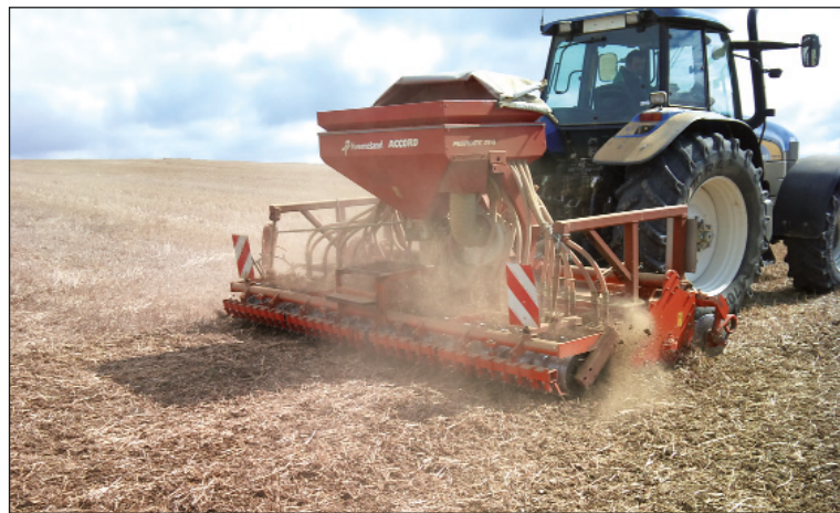
La Chambre d'Agriculture mène des essais sur les CIPAN en sols argileux. Une piste : travailler le sol avant d'implanter le couvert.

fumier de volailles), et jusqu'au 1 er octobre s'il s'agit de fumier de volailles ou d'effluents liquides. Ces périodes d'interdiction sont renforcées dans l'ouest du département (voir encadré). Veillez à prendre en compte la valeur fertilisante de ces amendements dans le calcul des doses d'azote à apporter aux cultures suivantes. L'épandage d'effluents avant légumineuses est interdit.