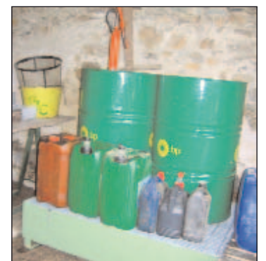
Bac de rétention intégré en acier.