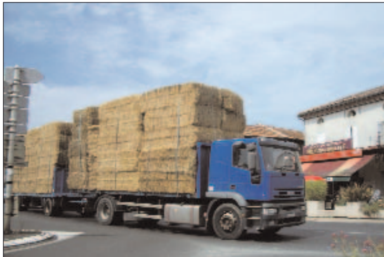
La formation des chauffeurs routiers est renforcée depuis le 10 septembre 2009

Cette obligation concerne dans les mêmes termes tous les conducteurs, quel que soit leur statut : - les salariés et non salariés - les conducteurs à temps plein - les conducteurs occasionnels détenant ou non la classification de conducteur.