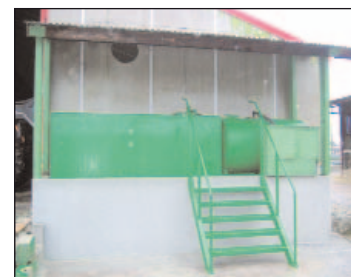
Cuve simple paroi avec bac de rétention en béton.