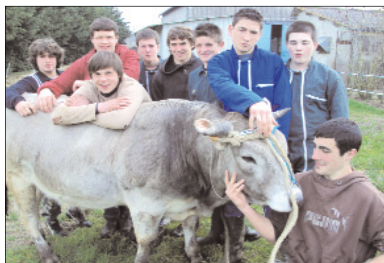
Elèves de Seconde Professionnelle production animale au Domaine de Valentées

La classe de Seconde du LPA de Mirande est spécialisée en productions animales.