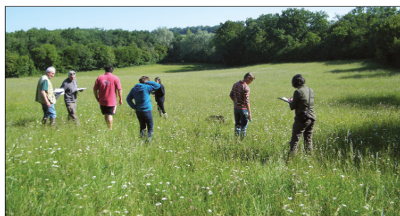
Le jury en plein travail.