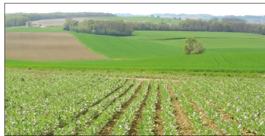
L'agriculture biologique s'est développée sur l'ensemble des territoires de Midi-Pyrénées, certains départements, comme l'Aveyron et le Gers, s'affichent comme les plus dynamiques.