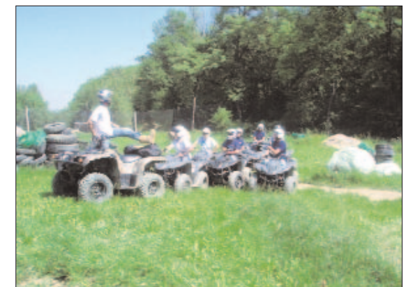
Formation quad - contrat de prévention

Cet appui peut également permettre de prendre en compte Les