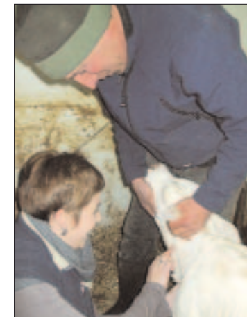
Réalisation du taux d'hématocrite

Les 15 février et 19 mars derniers s'est déroulée sur le site du CFAA Piémont Pyrénées à Saint Gaudens, une session de formation «Veau Sous La Mère» de 10 salariés des services de remplacement de l'Ariège, du Gers, de la Haute-Garonne et des Hautes-Pyrénées.