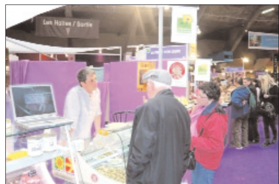
La convivialité sur les salons : rencontres et échanges avec les producteurs, ici à la SISQA.