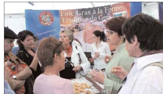
«Excellence Gers : partager le secret du bonheur, promotion et dégustation à Pentecôte à Vic-Fezensac».

Avec les filières du département et ses 118 sites qualifiés, Excellence Gers met tout en oeuvre pour promouvoir nos valeurs et apporter une vitrine commerciale complémentaire à ses adhérents au