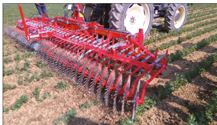
Herse étrille rotative