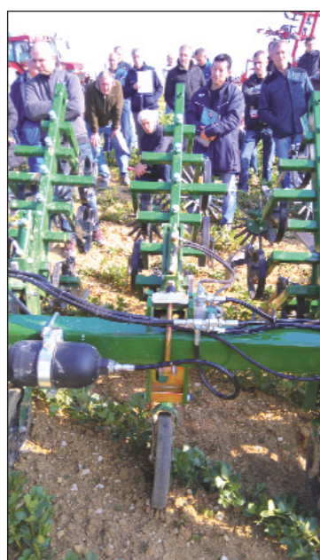
Bineuses autoguidées