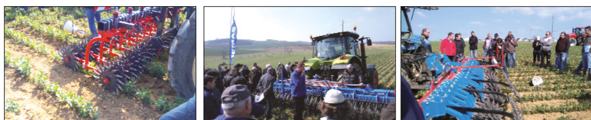
Houes rotatives