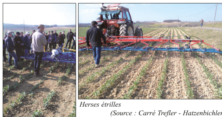
Herses étrilles