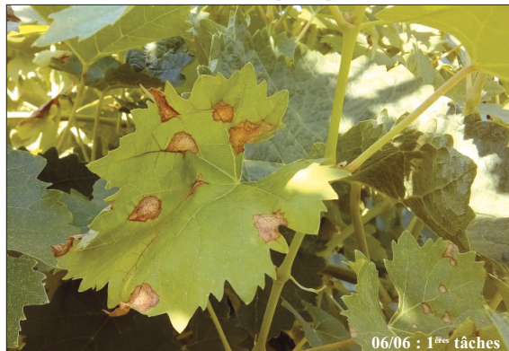
06/06 : 1 ère taches