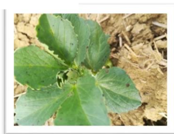
Botrytis sur Fève