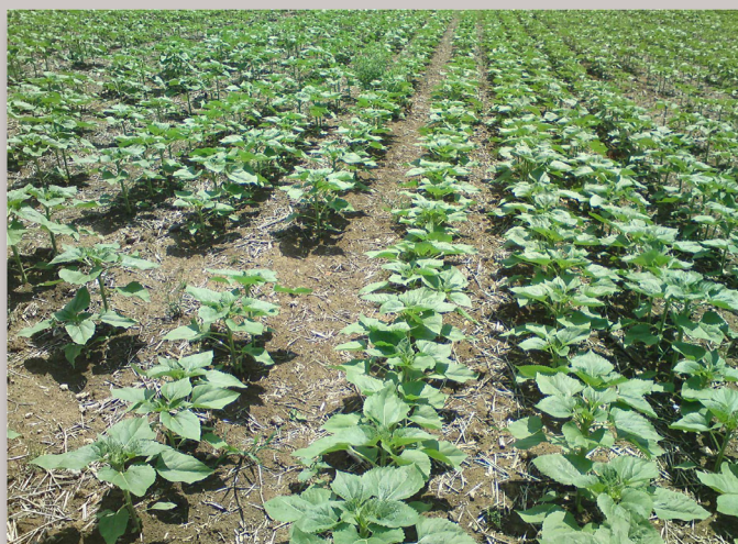
La levée du tournesol est satisfaisante, mais la préparation d'un lit de semence est nécessaire.