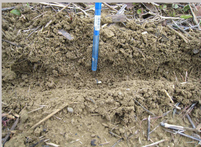
Le déchaumage réalisé début novembre crée un lit de semence favorable à la levée du tournesol au printemps.