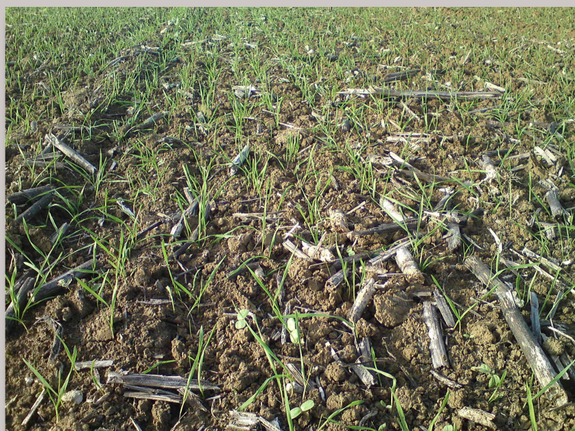
Blé dur implanté après un tournesol, les résidus restent en surface.