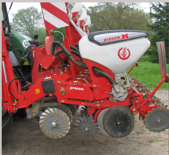
Le semoir monograine Sola 7 rangs.