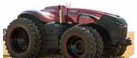
Le Magnum autonome.