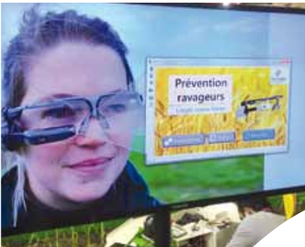
Lunettes connectées.

Adventiel a présenté au salon de l'agriculture 2016 les premières applications de ses lunettes connectées de la marque Vuzix.