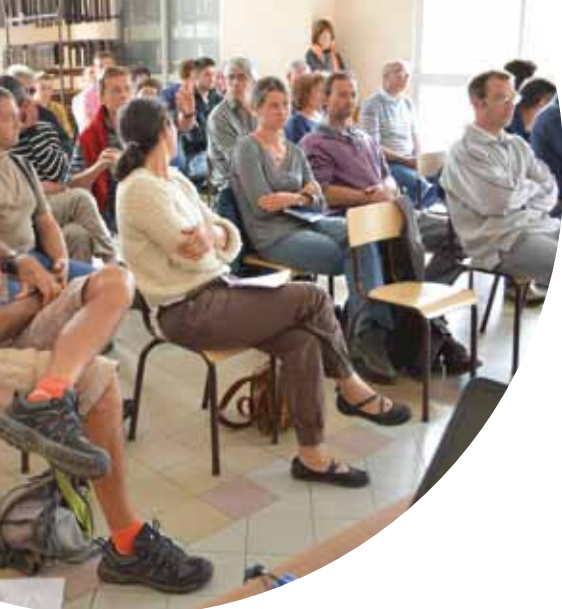
Salle comble au GAT élevage.