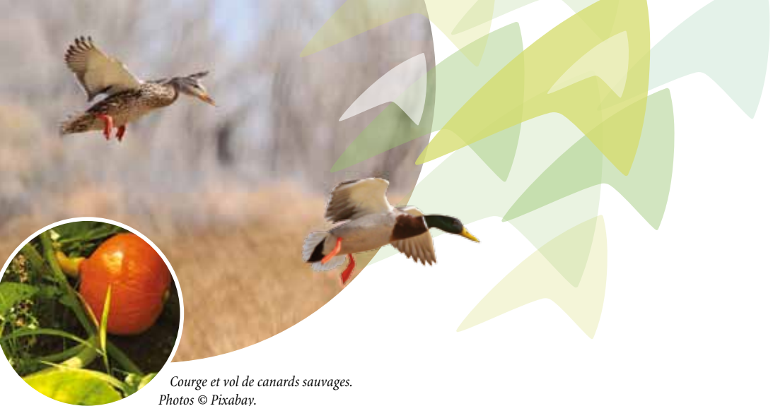
Courge et vol de canards sauvages.

L'agriculture et les agriculteurs font aujourd'hui l'objet de fortes attentes de la part de la société : Proposer des produits locaux, diversifiés et de qualité, tout en gérant les paysages et préservant l'environnement. Cependant, malgré une occupation du territoire importante et un rôle reconnu dans la structuration et la préservation des milieux ainsi que dans la diversité des paysages, les espaces agricoles, support des productions, sont consommés à un rythme soutenu. Ces défis se trouvent souvent résumés sous la bannière de la Responsabilité Sociétale des Entreprises (RSE) dans laquelle, au travers du projet agricole départemental Hérault 2020, la Chambre d'agriculture de l'Hérault s'est engagée.