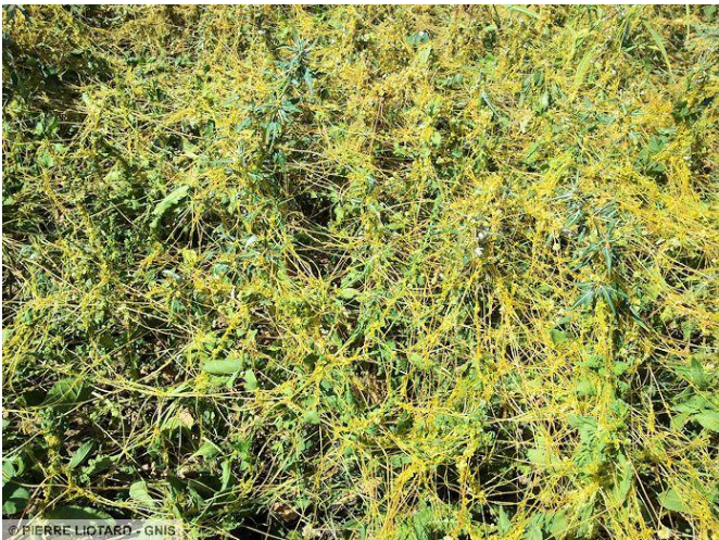
La cuscute germe au sol au printemps et la plantule développe de longs filaments jaunes qui s'accrochent à la luzerne. Une seule graine de cuscute peut

contaminer et détruire une luzernière sur 100 à 150 m 2 .