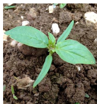
Grands cotylédons effilés

Le datura se caractérise par sa capacité pour absorber les éléments toxiques comme les métaux lourds. C'est donc un bon indicateur de sols pollués (DUCERF).